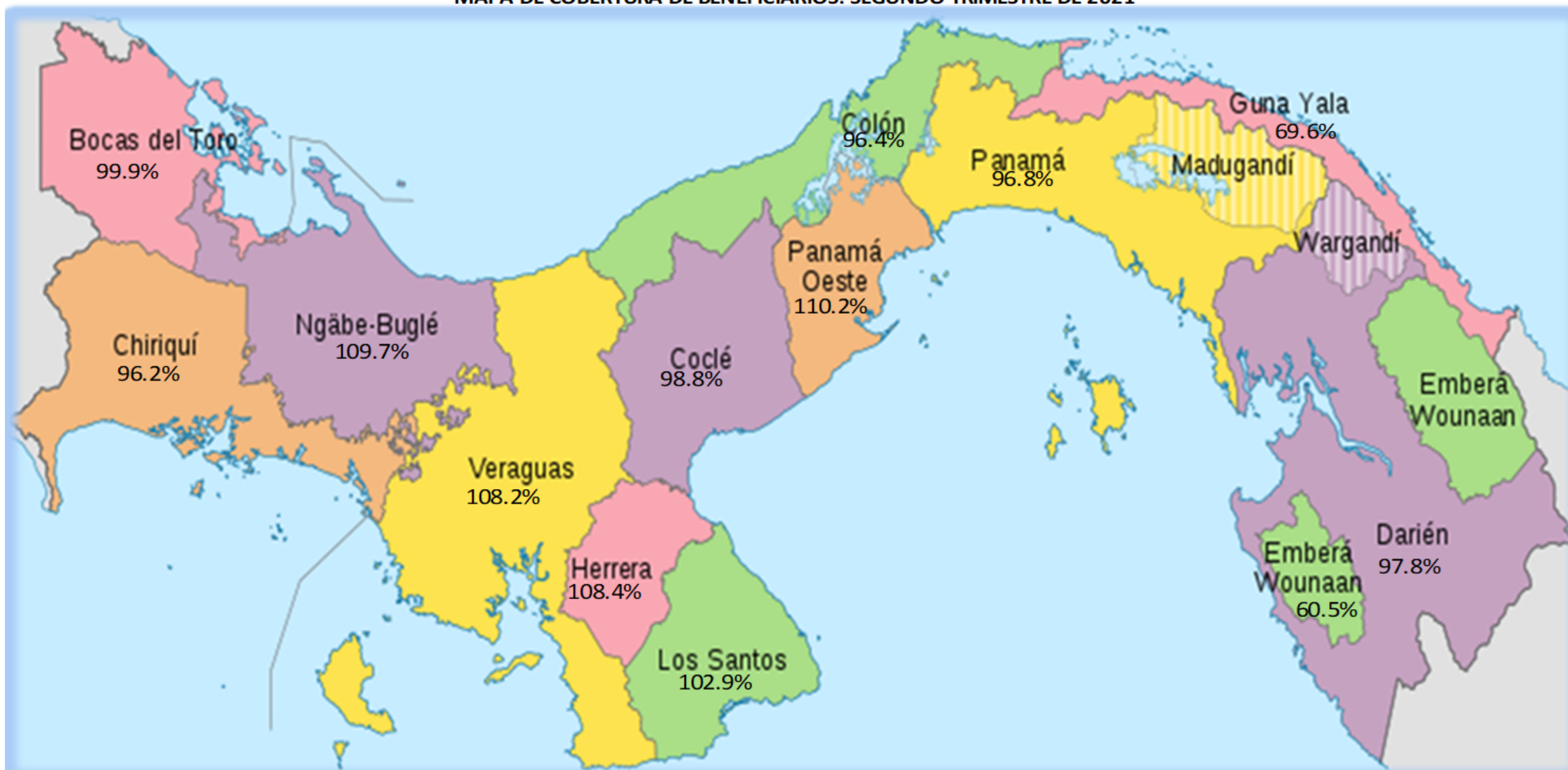
MAPA DE COBERTURA DE BENEFICIARIOS: SEGUNDO TRIMESTRE DE 2021