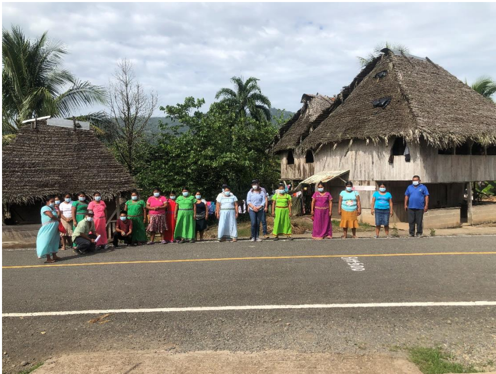
Distrito de Ñurum, Corregimiento de Cerro Pelado