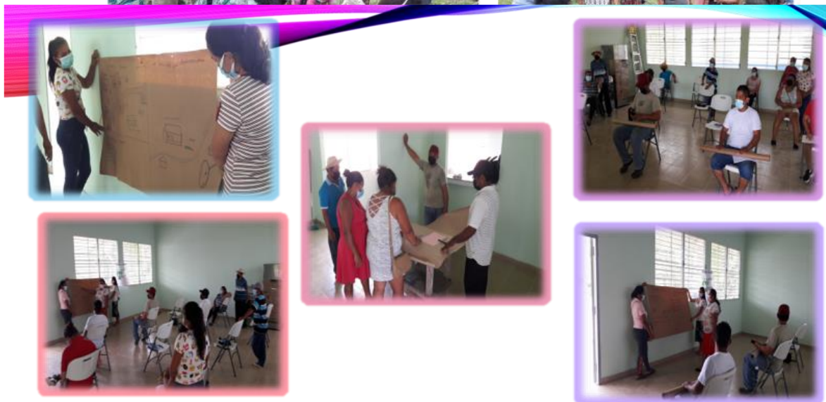
TALLER DE PLANIFICACIÓN PARTICIPATIVA: "LA COMUNIDAD QUE TODOS QUEREMOS"

12 de abril , se realizó el taller de Taller de motivación "La comunidad que todos queremos", enfocado en la Planificación Participativa a actores relevantes de la comunidad de la Negrita del Corregimiento de Cacao (Distrito de Capira). Con la finalidad de Fomentar la participación activa de los participantes en el desarrollo de su comunidad y promover el trabajo en equipo. Se contó con la participación de 13 actores locales; entre ellos beneficiarios de programas de Transferencia Monetaria, Comité de Agua, Comité de iglesia, Educadores, Presidente del patronato de Granjas comunitarias.