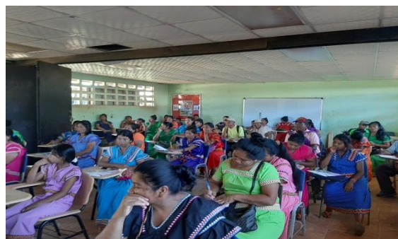
Jornada en Llano Ñopo.

El 11 de febrero la Dirección de Proyectos Especiales del Ministerio de Desarrollo Social solicitó cortesía de sala al Consejo Municipal donde estuvieron presentes los representantes de los diferentes corregimientos de Capira, con la finalidad de presentar el Programa de Cohesión Social para así recibir la aceptación y el apoyo de las autoridades locales. Por otro lado, también se realizó una inducción en las instalaciones de la Gobernación de la Provincia de Panamá Oeste donde estuvieron presente la Gobernadora Nora Escala, junto a su equipo de trabajo.