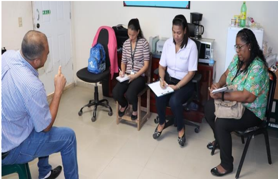
Reunión con administrador de la Junta Comunal de Ollas Arriba