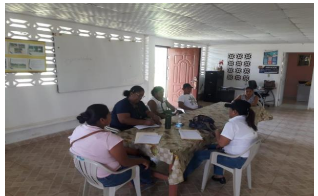
Reunión con la Asistente de la HR.de Ciri Grande Capira

Del 10 al 14 de Febrero del presente año participamos de la Jornada de Concertación comunitaria y caracterización de Sistemas Productivos, del proyecto COHESAL- Inclusión productiva en el distrito de Muna, corregimiento de Roka, comunidad de Llano Ñopo, de esta forma se logra productos como: Firma del Consentimiento Libre Previo Informado, la caracterización de los sistemas productivos y la Organización comunitaria para el desarrollo del proyecto que formaran partes de las Escuelas Campos la