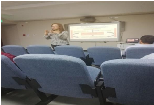
Explicación de cohesión social e inclusión social.