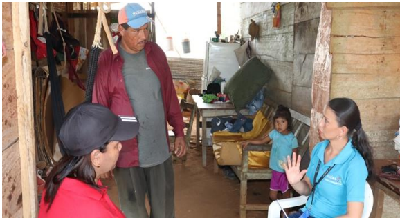
Comité del Club de Padres de Familia y Presidente del Patronato de la granja comunidad de Santa Rosa N°2