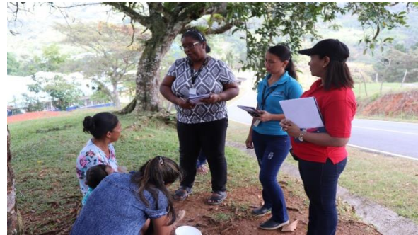
Esposa del delegado de la Iglesia Católica, Comunidad de Santa Rosa N°2.