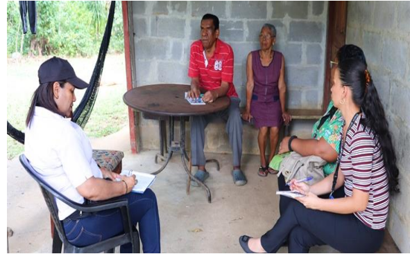
Líder Comunitario del Comité de Discapacidad en Ollas Arriba