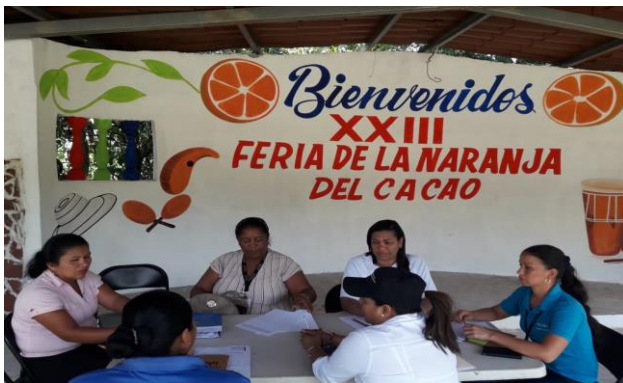
Reunión con la HSR de la Comunidad del Cacao de Capira