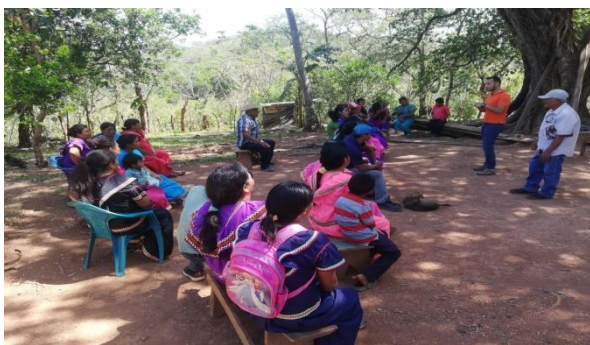
Desarrollo del proyecto cohesal-inclusion productiva. a los beneficiados

cual será implementada articuladamente, luego de esta actividad se procede a una gira de coordinación y presentación de los técnicos de campo por la FAO, MIDA, MIDES a las 28 comunidades beneficiadas dentro de los 4 distritos, de la cual los técnicos de COHESAL le correspondió atender el martes 11, la comunidad de Buenos Aires-El Chumico y el Piro #2, Cerro Miel, Alto Mango, miércoles 12 El Peñón_ Palo verde, Israel Corrales, jueves 13 Batata_ Mojarra, Piedra, Hacha, Pavón, Viernes 14 La Trinidad _ La Mesita, Llano San Martin.