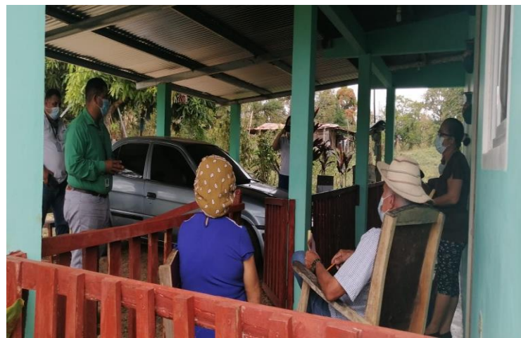
Distrito de Tonosí, Agua Caliente: Se realizó visita a las tinas de tilapias.