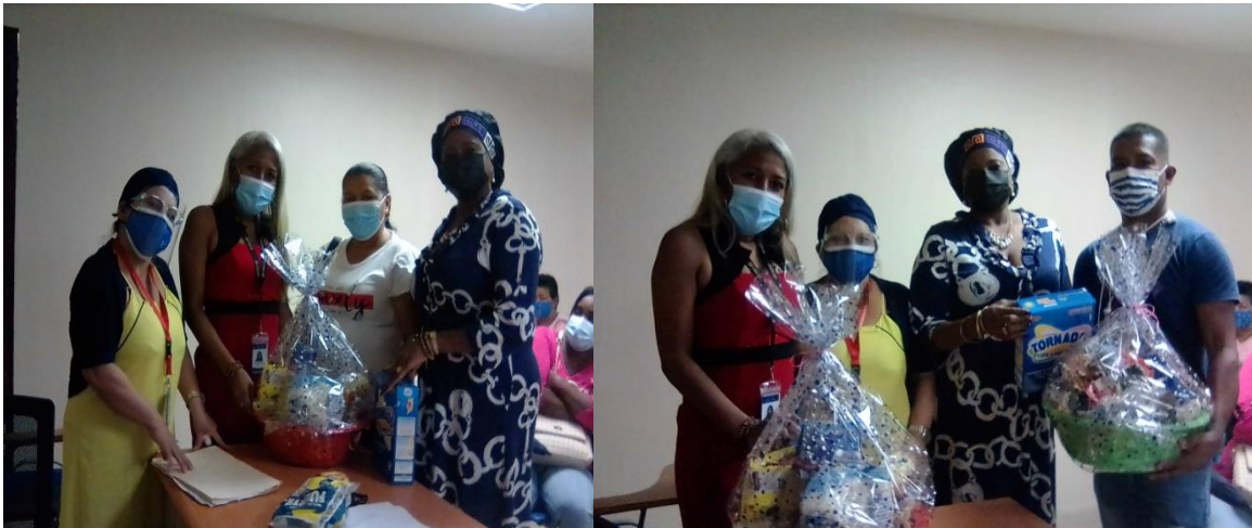
El personal realizo una recolecta de alimentos secos, los cuales fueron distribuidos en dos canastas donadas a dos afortunados padres de familia en la reunión.