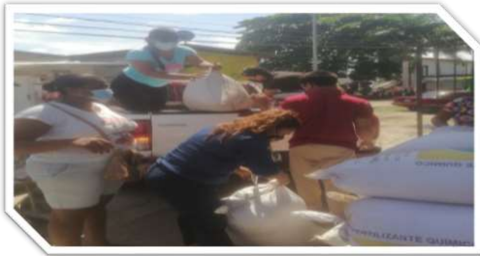
Entrega de cascarilla a 29 beneficiaria del plan piloto Santa Fe, Zapalla y Arimae