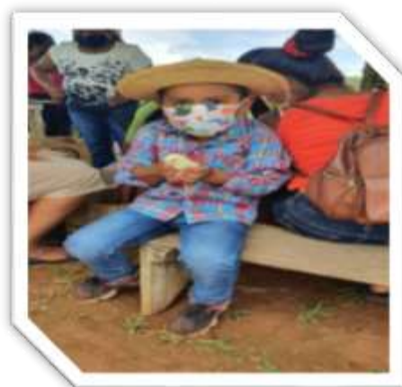
DISTRITO LA PINTADA, CORREGIMIENTO PIEDRAS GORDAS