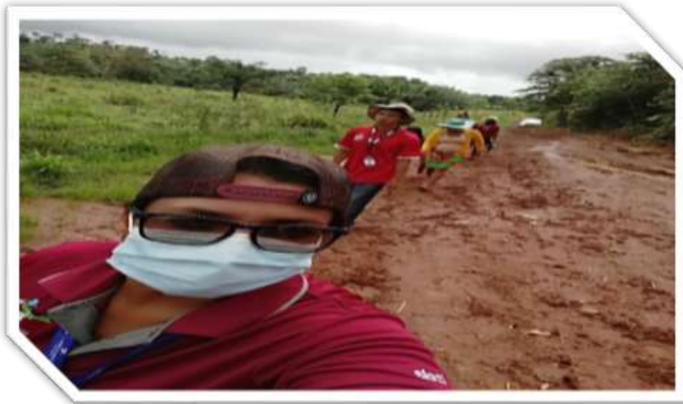
Distrito de: Santa Fe, Corregimiento de Santa Fe Cabecera, Comunidad: Barrales

Visita de seguimiento a beneficiarias y asesoria tecnica.