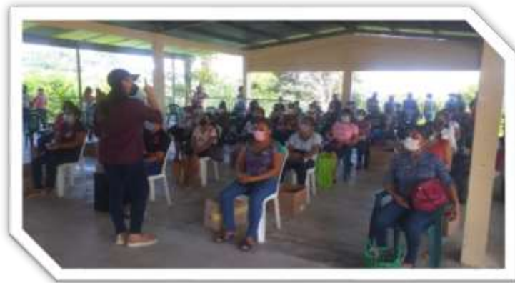
Licda. Onelia Peralta/Directora Nacional de Inversión Para el Desarrollo del Capital Social