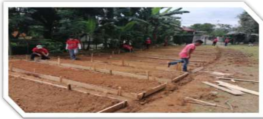
Distrito las Palmas, Corregimiento Viguí, Comunidad Viguí (30 beneficiarias)