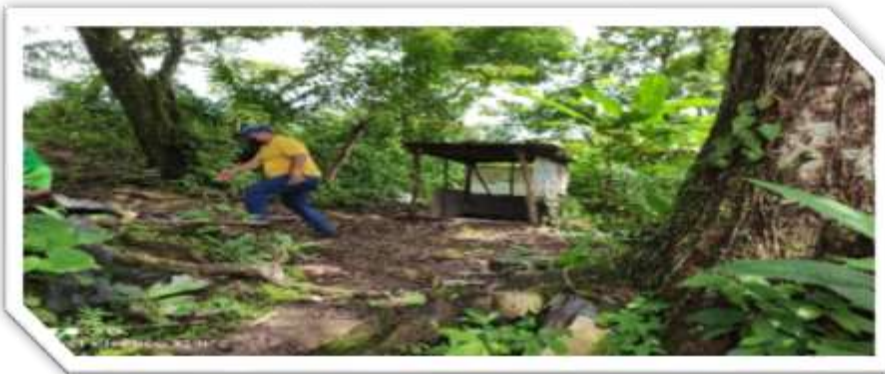
Distrito Soná, Corregimiento Rodeo Viejo, Comunidad Rodeo Viejo, Boca del Monte, Los Algarrobos. (14 beneficiarias)

Inclusión Productiva/ Preparación de Escuela Campo, con el objetivo de formarlos para mejorar los niveles de producción de las familias beneficiadas de la Red de Oportunidades e 2da. Fase del Plan - Piloto Banco Mundial / Plan Colmena.