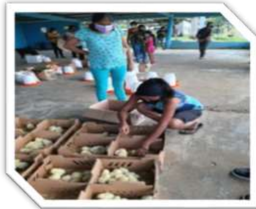
DISTRITO ANTON, CORREGIMIENTO SAN JUAN DE DIOS, COMUNIDAD ALTO LA ESTANCIA.