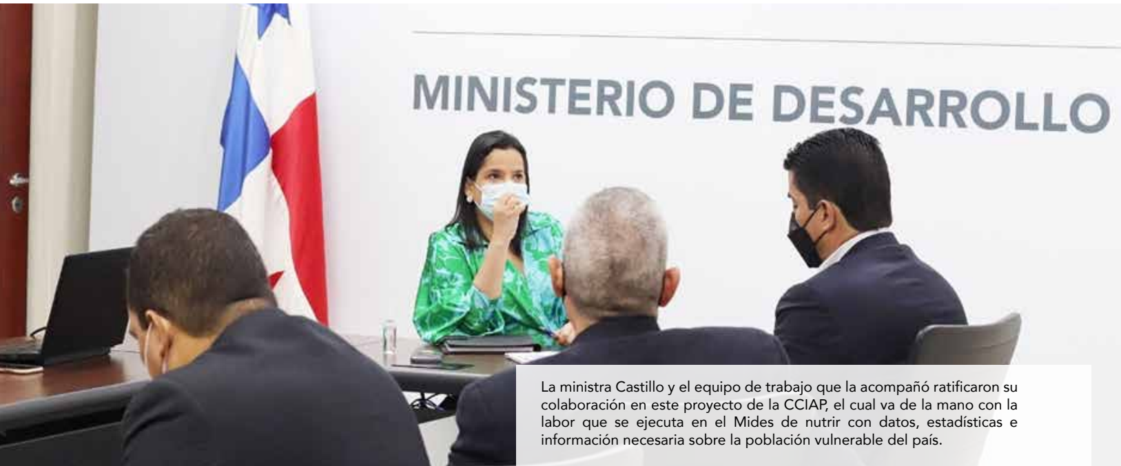
La ministra Castillo y el equipo de trabajo que la acompañó ratificaron su colaboración en este proyecto de la CCIAP, el cual va de la mano con la labor que se ejecuta en el Mides de nutrir con datos, estadísticas e información necesaria sobre la población vulnerable del país.

E l Ministerio de Desarrollo Social (Mides), a través de la ministra María Inés Castillo, fue invitado a formar parte de la Comisión Técnica que estará evaluando el segundo informe del observatorio “Panamá, ¡cuéntame!”, un proyecto de la Cámara de Comercio, Industrias y Agricultura de Panamá (CCIAP), que mide la calidad de vida del ciudadano.