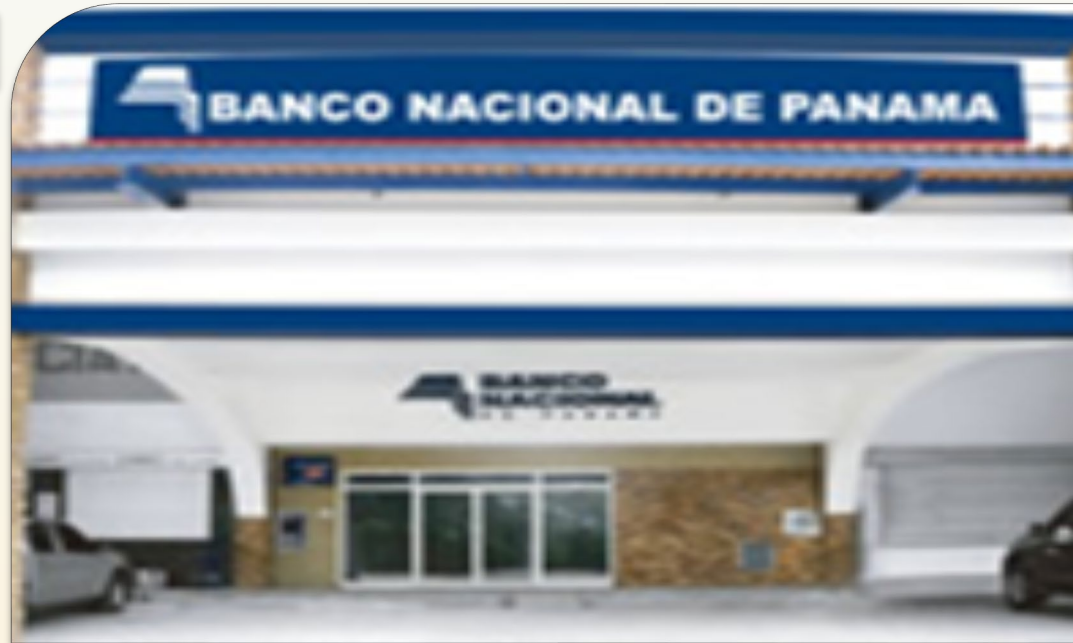
Pago en Sucursales del Banco Nacional de Panamá