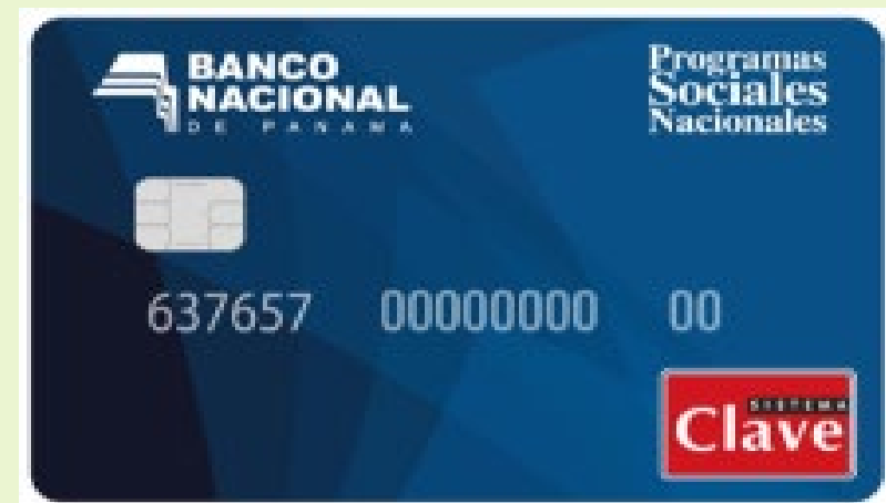
Pago de Difícil Acceso