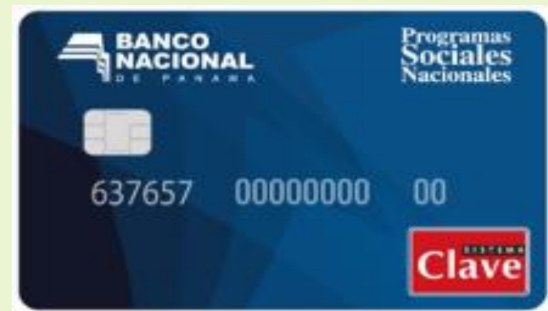
Pago de Difícil Acceso