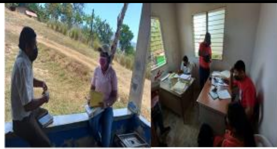
Casa de Paz de Cerro Puerco