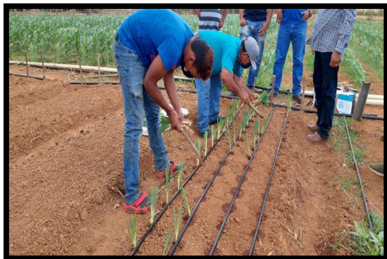
Cultivos proyecto riego – Guayabal Capacitación sobre siembra y cultivo de cebollina