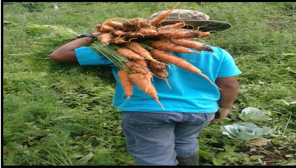
CULTIVO DE ZANAHORIA AREA DE CALABAZO PROYECTO INCLUSIÓN PRODUCTIVA. 15 FAMILIAS BENEFICIADAS