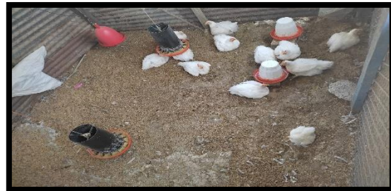
Aplicación de fomularios (Proyecto de inclusión productiva fondo MIDES 2021)