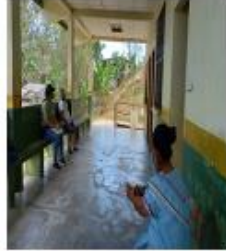
Puesto de Salud de Kikari