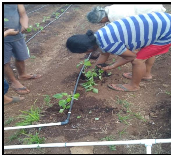
Siembra de pimentón