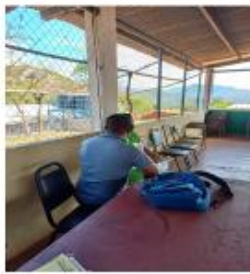
Junta Comunal de Cerro Caña