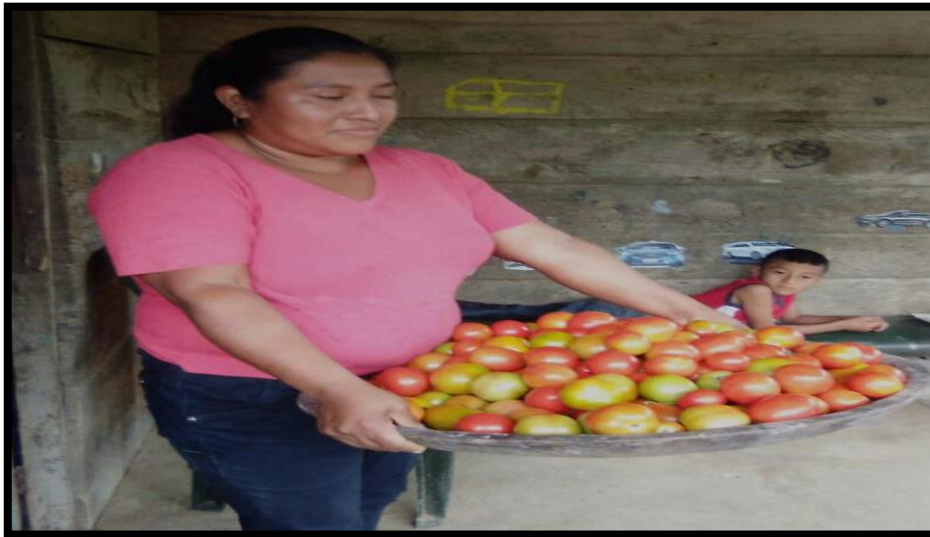
PROYECTO INCLUSIÓN PRODUCTIVA CORREGIMIENTO CHIGUIRI ARRIBA ESCUELA PALMILLA. 16 FAMILIA