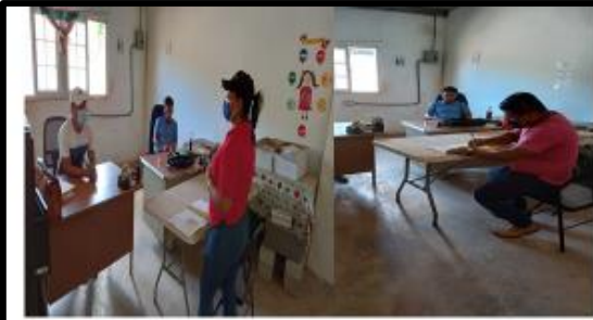
Junta Comunal de Sitio Prado