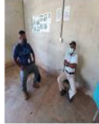
Junta Comunal de Kikari