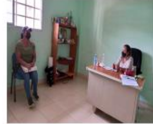
Centro Educativo Básico del Corregimiento de Kikari