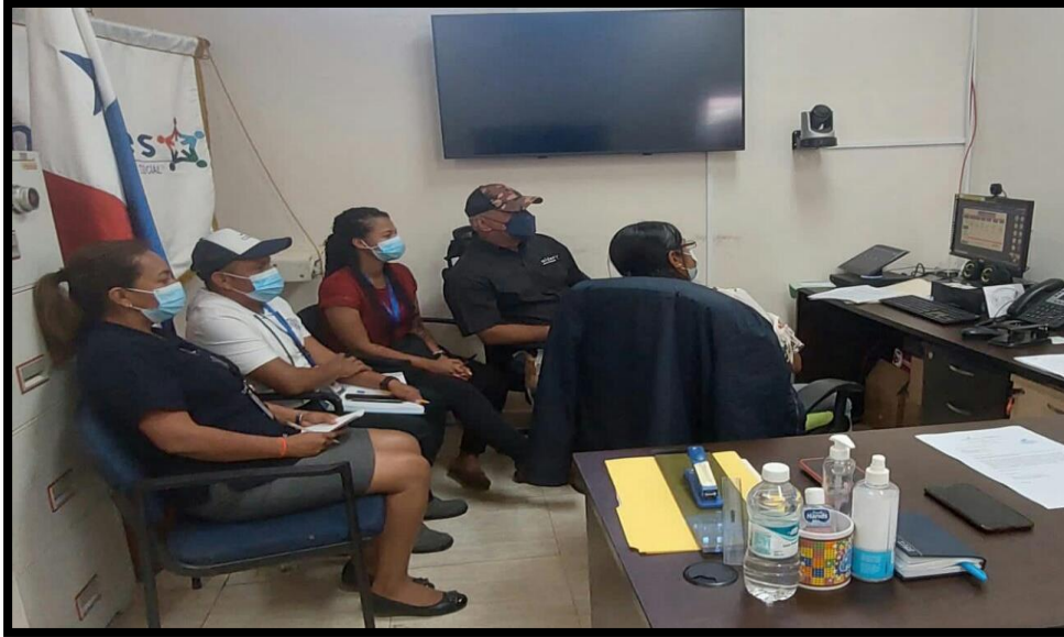
PARATICIPACION DE LA DIRECTORA PROVINCIAL DE COCLE Y PERSONAL REDES TERRITORIALS EN LA JORNADA DE INTERCAMBIO TECNICO SOBRE PROGRAMA DE INCLUSION PRODUCTIVA (DICAS) CON EL DEPARTAMENTO DE PROSPERIDAD SOCIAL DE COLOMBIA