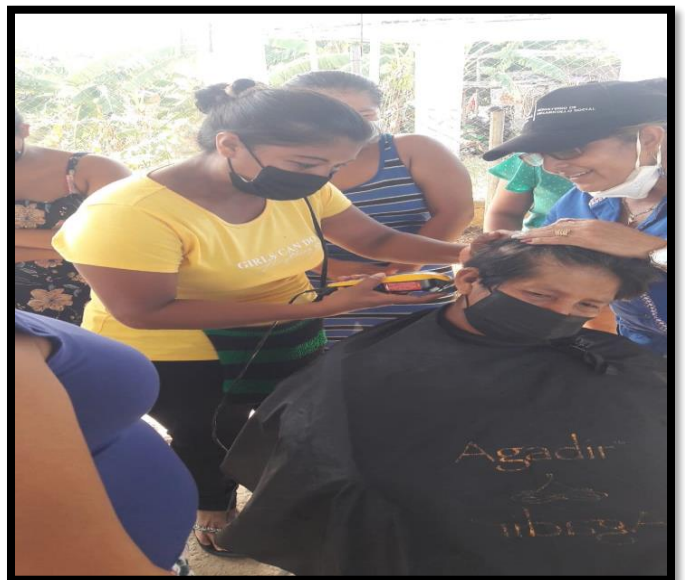
Clase de corte de cabello