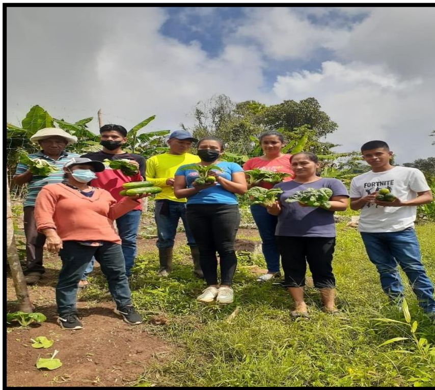
SEGUIMIENTO ESCUELA DE CAMPO, CORREGIMIENTO TOABRE, AREA BOCA TOCUE, CULTIVADOR DE HORTALIZA, PROVINCIA DE COCLÉ. 10 FAMILIAS BENEFICIADAS