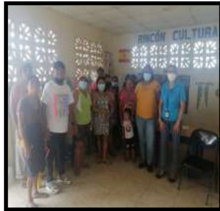
DISTRITO DE ARRAIJA Sensibilización a líderes de la comunidad Bóyala