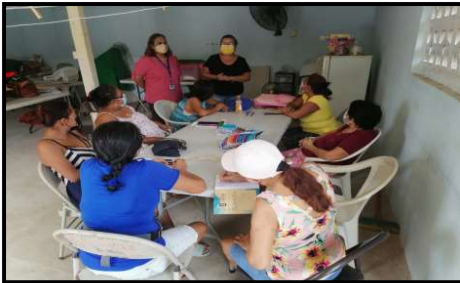
Inicio de curso bordados español dirigido a 15 mujeres emprendedoras, Corregimiento Ancón, Comunidad Kuna Nega.