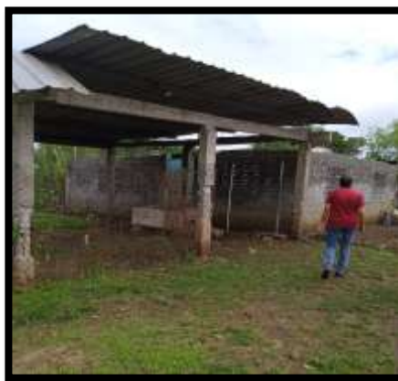
Identificación De Líder En La Comunidad La Cascada