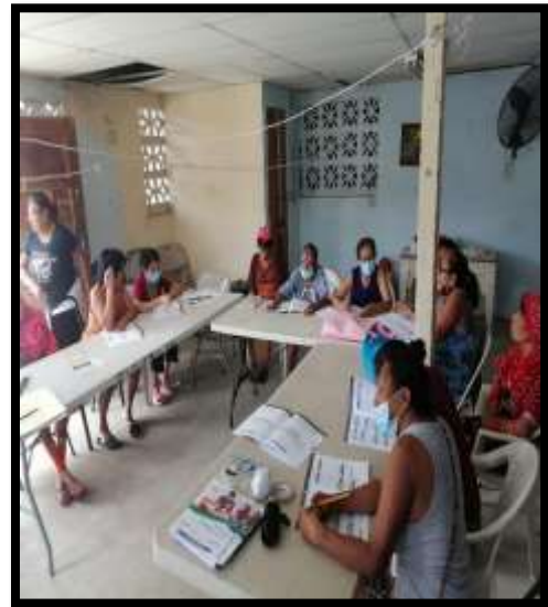
Capacitación en tema de Educación Financiera Tema Ingresos Familiares a 15 mujeres emprendedoras, Corregimiento Ancón, Comunidad Kuna Nega.