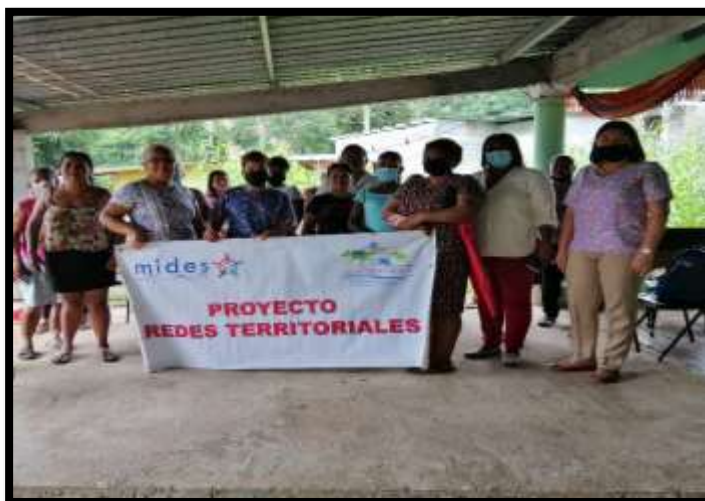
Curso de autoestima en la comunidad la cascada