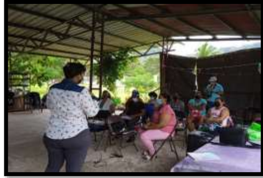
COMUNIDAD VALLE DEL SOL TALLER DE VALOR, LA FAMILIA Y EMOSIONES 14 BENEFICIARIAS