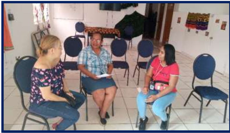
Reuniòn de Coordinaciòn con la Administradora de la Junta Comunal de Curundu