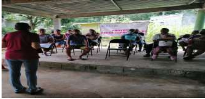
Taller de planificación participativa y selección del proyecto de entusiasmo