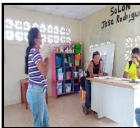
Sensibilizacion del proyecto en la Comunidad la Cascada