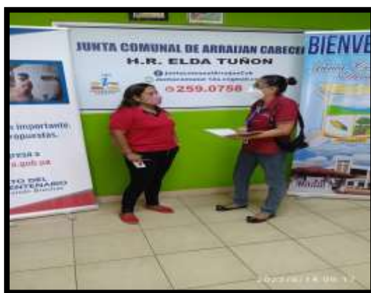
CONVERSATORIO CON LA H.R. ELDA TUÑON 2022