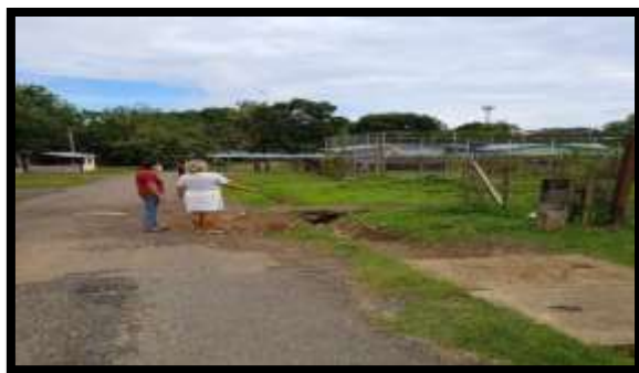
Actores Focalizados En El Territorio La Cascada