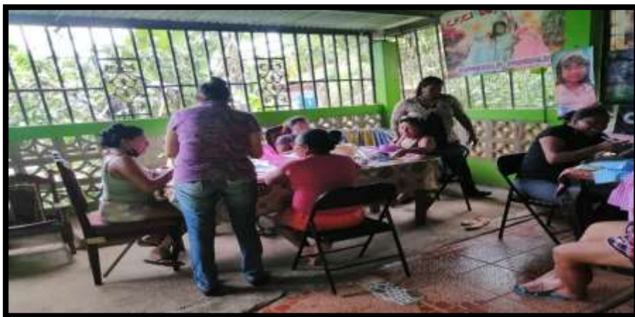
INICIO DEL CURSO DE PUNTADA ESPAÑOLA COMUNIDAD BOYALA 10 BENEFICIARIAS