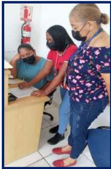
Aplicaciòn de Ficha Tecnica, para el Mapeo de Actores (Corregimiento de Curundu)