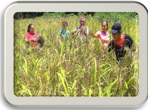
Cosecha de plátano, arroz en las áreas de Boca tucue y Paso Real, Provincia de Coclé 14 familias beneficiarias