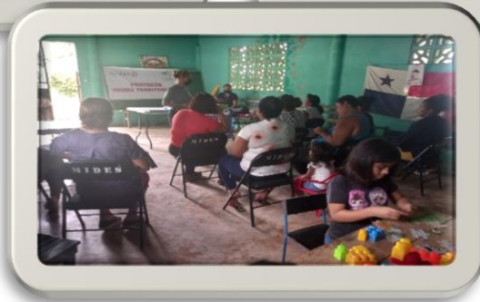
Capacitación en el tema de Desarrollo de autoestima y superación personal, comunidad de María Enrique Rural.