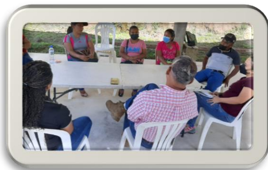
Actores de Proyecto de Inclusión Productiva Focalizados (5 familias) participarán en El mes de octubre del presente año en Proyectos de consultoría en temas de mercadeo y comercialización - Consultora Yiseth Córdoba / Banco Mundial