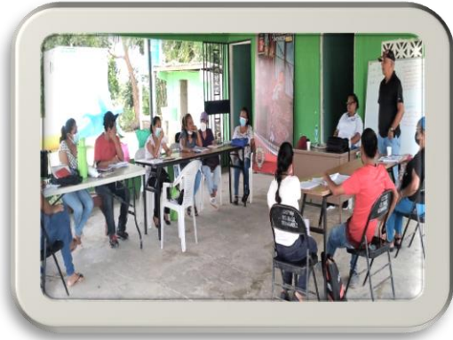
Clausura de Curso de Cultivo de Hortalizas, 22 participantes impartido por técnicos del INADEH- Provincia de Coclé, Corregimiento San Juan de Dios, Distrito de Antón.