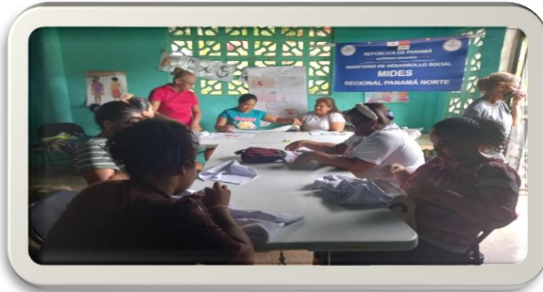
Seguimiento al curso de costura yugoslavo comunidad de María Enrique Rural