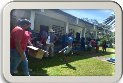
Apoyo a la Regional de Panamá Norte a la Gira de inclusión en la comunidad de Las Tranquillas, corregimiento de Caimitillo